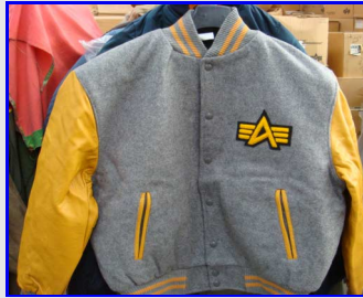
Bomber MA-1 Baseball Yellow Vintage Made in USA